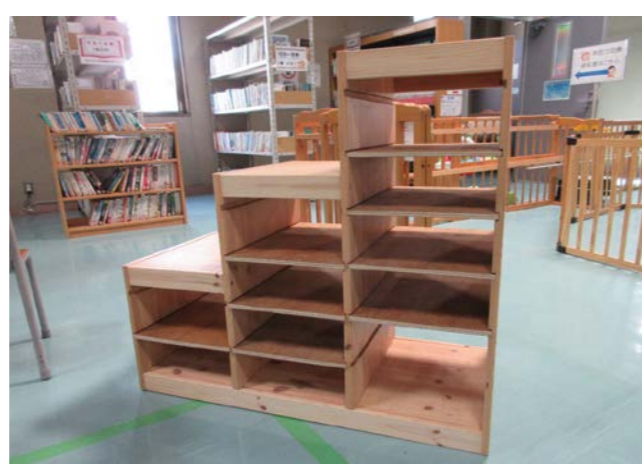
⑥ 手作り家具 落札額 2,000円/応札 2件