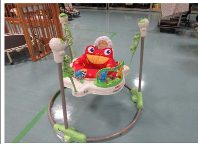
③ 室内遊具 落札額 320円/応札 1件