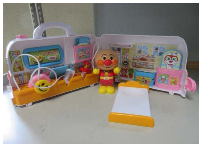
⑤ アンパンマンのお医者さんセット 落札額 1,050円/応札 6件