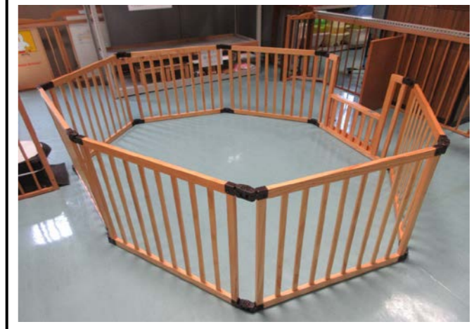
④ サークル 落札額 2,500円/応札 6件