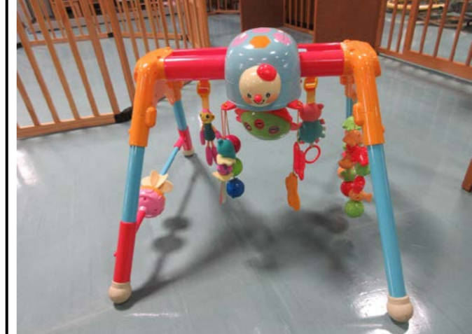
⑫ メリー&ジム 落札額 1,070円/応札 2件