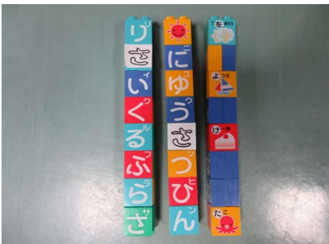
⑨ あいうえおブロック 落札額 2,100円/応札 2件