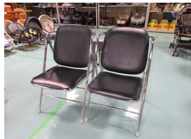
② 椅子(2脚) 落札額 2,250円/応札 2件