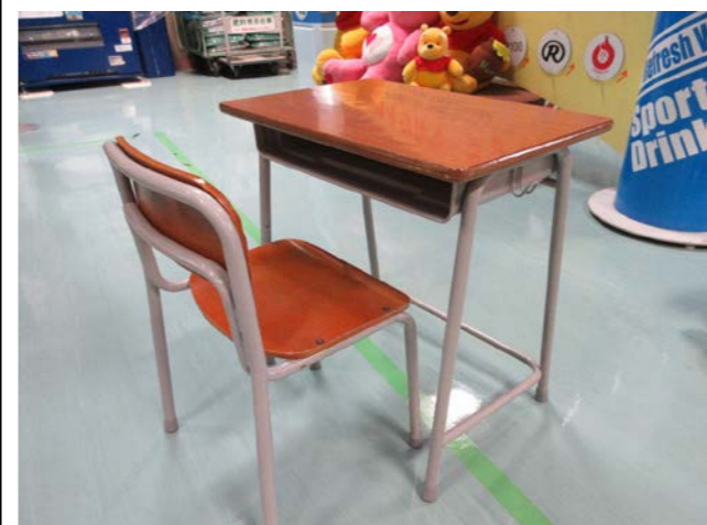
⑪ 机と椅子 落札額 500円/応札 4件