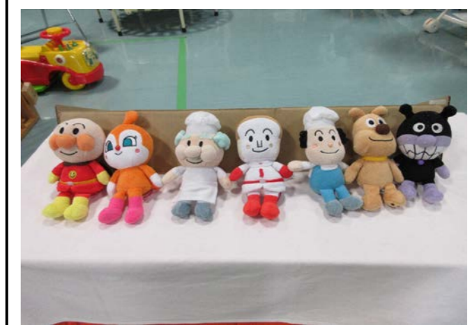
⑧ アンパンマンのぬいぐるみセット 落札額 2,100円/応札 5件