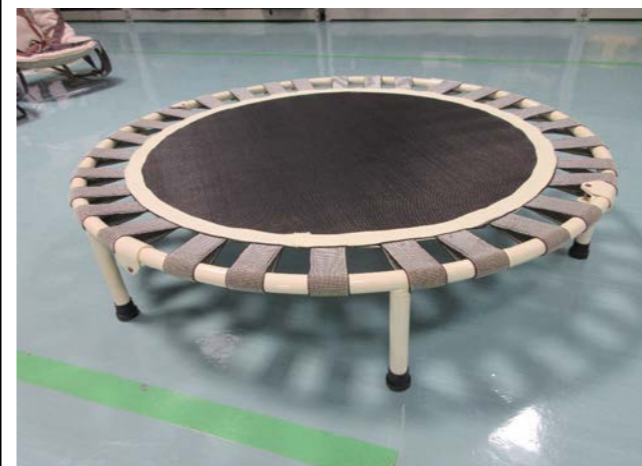
⑦ トランポリン 落札額 2,100円/応札 5件