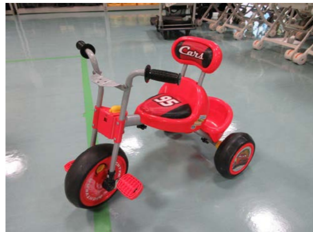
⑩ 三輪車 落札額 2,500円/応札 6件