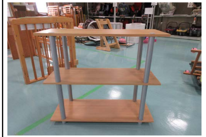
④ 3段飾り棚 落札額 520円/応札 4件