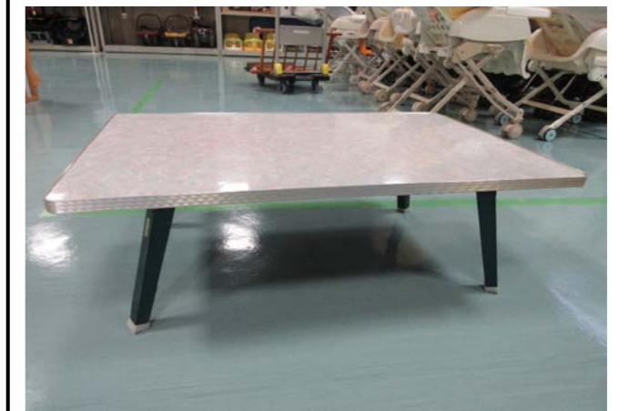
⑧ 折りたたみテーブル 落札額 0円/応札 0件