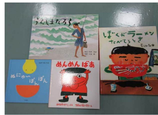
③ 絵本 4冊 落札額 150円/応札 1件