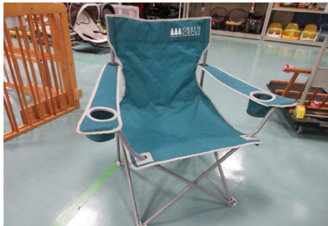
⑤ アウトドアチェア 落札額 330円/応札4件