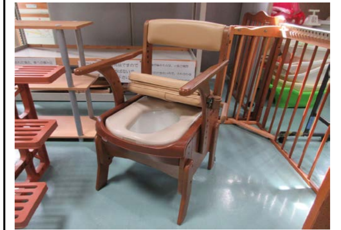
⑫ ポータブルトイレ 落札額 1,010円/応札 1件