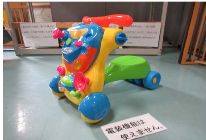
① ウォーカー&ライド 落札額 0円/応札0件