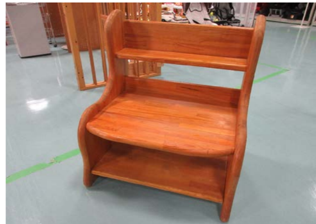
⑦ 多様台(踏み台、本棚など) 落札額 850円/応札 1件