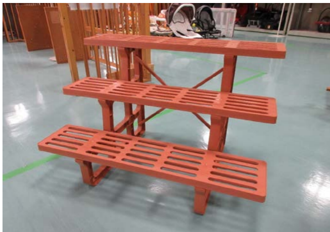
⑨ フラワースタンド 落札額 2,000円/応札7件