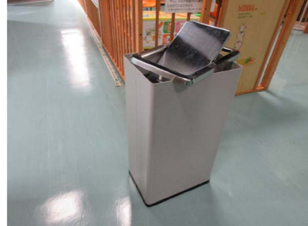
⑪ ごみ箱 落札額 330円/応札 1件