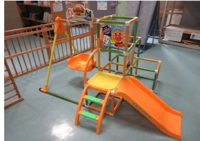
⑥ ブランコパーク 落札額 4,000円/応札 8件