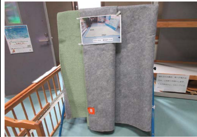
② カーペット 落札額 0円/応札 0件